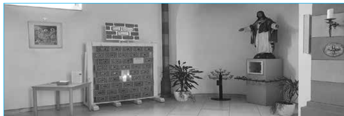
St. Johannes Baptist Markhausen

Auf Initiative des Pfarreirates wurde in Zusammenarbeit mit den Gemeindeausschüssen in allen sechs Kirchen der Pfarrgemeinde St. Marien Friesoythe eine Klagemauer erstellt.