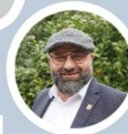
Sven Stratmann Bürgermeister Stadt Friesoythe

„Die St.-Marien-Kirche erzählt ein Stück Geschichte Friesoythes und steht für Beständigkeit, Glauben und Zusammenhalt. Die Kirche ist ein Ort der Begegnung und der Freude für viele Menschen in der Mitte unseres Stadtzentrums. Mit der Sanierung sichern wir dieses wertvolle Erbe und den lebendigen Mittelpunkt für die kommenden Generationen - ganz im Sinne unseres Mottos 'Friesoythe verbindet' - für die Zukunft erhalten.“